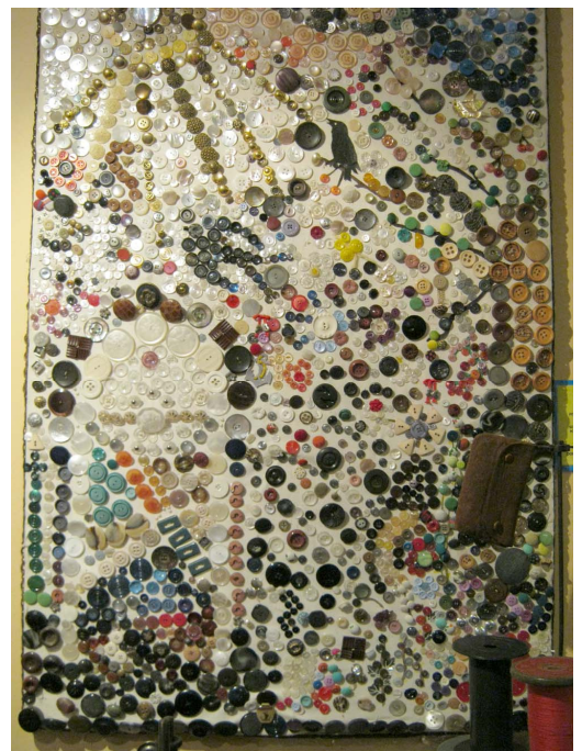
Perleporten lavet af Knapper.