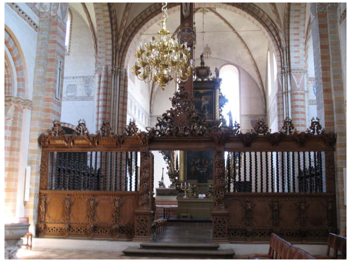
Sorø-Klosterkirke er en af de største middelalderkirker i Danmark.