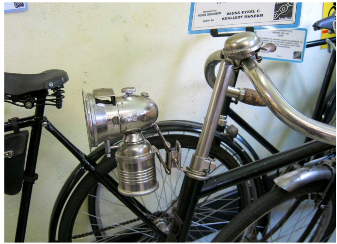
Dansk Cykel- & Knallertmuseum i Glumsø.