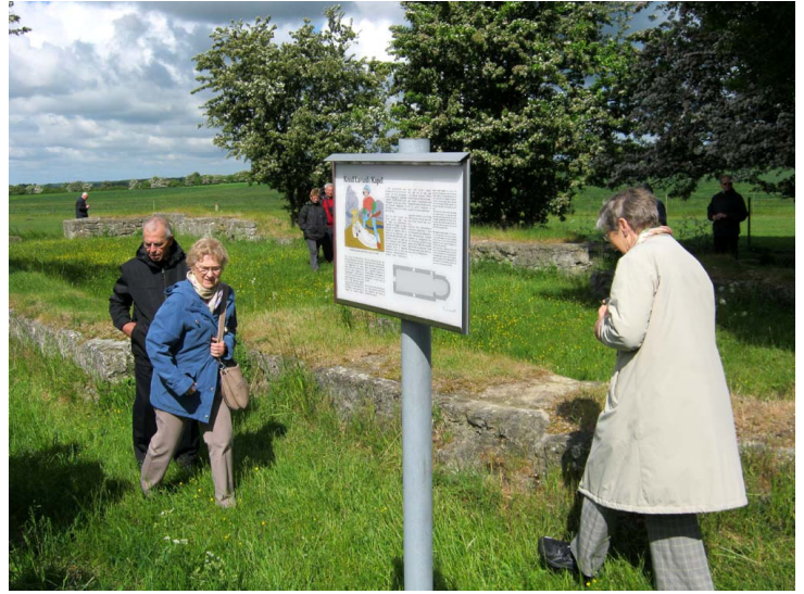
Knud Lavards Kapel ved Haraldsted.