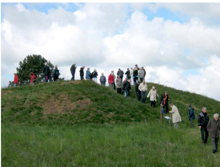
Hagbardshøj, der ligger 4 kilometer syd for hovedvej 1, er en gammel gravhøj, der menes at stamme tilbage fra bronzealderen.