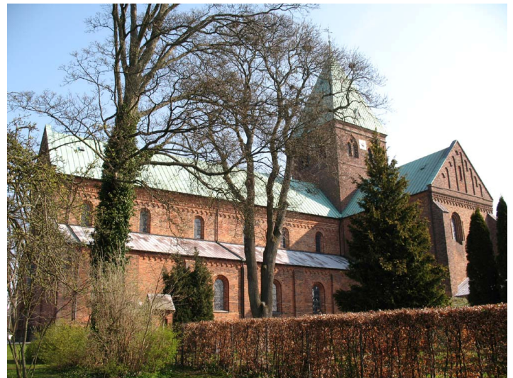
Sct. Bendts Kirke i Ringsted.