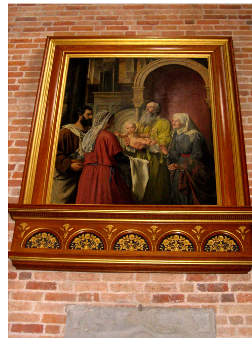
Sct. Bendts Kirke i Ringsted.