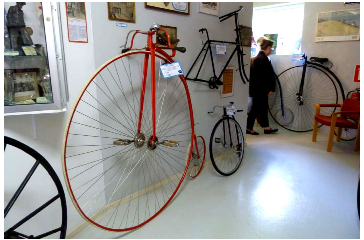
Dansk Cykel- & Knallertmuseum i Glumsø