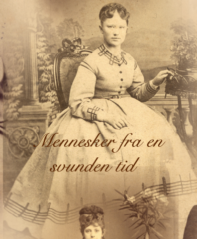
Mennesker fra en sunden tid