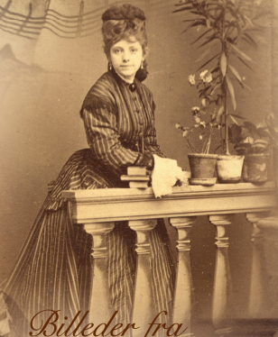
Billeder fra forbryderalbum