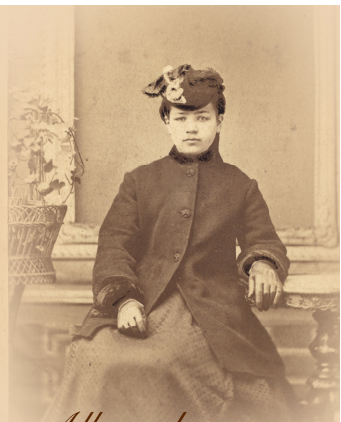
Alle med en trist skæbne!