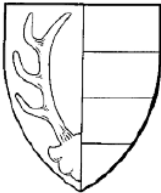
EN HJORTEVIE OG TRE GANGE TVÆRDELT